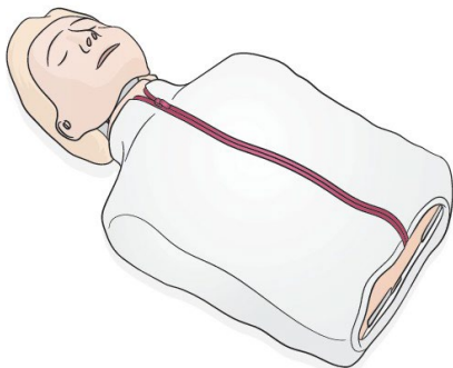
Little Anne Reanimationspuppe, Firma Laerdal Medical

Um unsere Workshops optimal halten zu können und die Lehre dabei auf einem konstant hohen Niveau halten zu können, haben wir durch unsere Partner die notwendige Ausrüstung zur Verfügung gestellt bekommen, wofür wir sehr dankbar sind. So konnten wir Notfalltaschen, Rettungsrucksäcke, Reanimationspuppen sowie eigene Übungs-Defibrillatoren anschaffen.